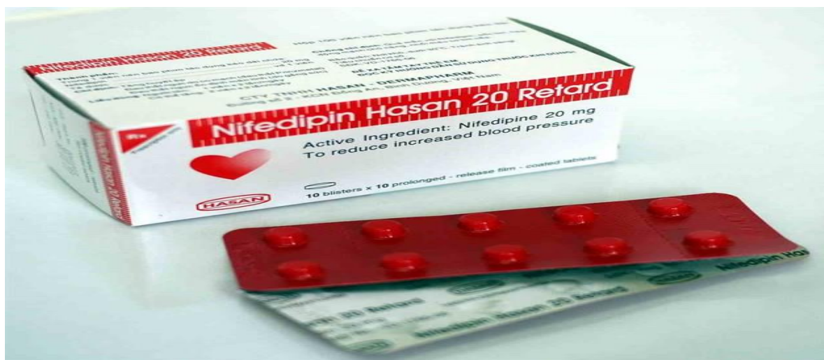
Thuốc sử dụng tại bệnh viện

Nifedipin được chỉ định cho: kiểm soát cơn đau thắt ngực ổn định mạn tính và đau thắt ngực do co thắt mạch (đau thắt ngực Prinzmetal, đau thắt ngực biến đổi) do bệnh mạch vành- điều trị tăng huyết áp.